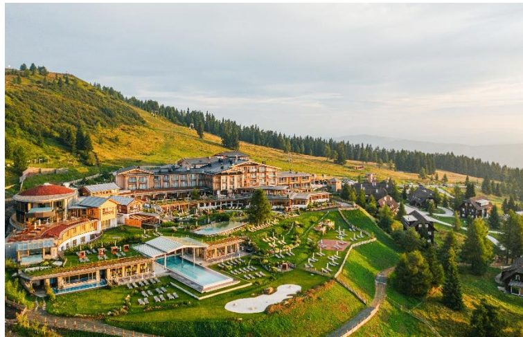
Das neue Gesicht des Feuerbergs

der Firmen Pichler und Schabus am Umbau beteiligt. Poolbau und -technik übernahmen die Firmen Heidenbauer und GWT.